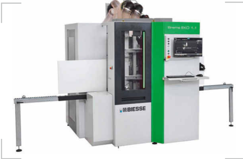
! Kompakt, flexibel und benutzerfreundlich ist die CNC-Bohrmaschine Brema Eko 1.1. Sie wurde speziell für kleinere Schreinereien entwickelt.